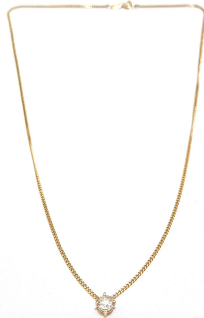
Gargantilha veneziana em ouro 18k modelo "ponto de luz" com 1 diamante de 20 pontos R$ 5.148,00 5x R$ 1.029,00