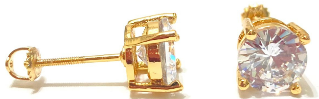
Brinco modelo "ponto de luz" em prata com banho de ouro, zircônia e com R$ 148,00 5x R$ 30,40