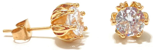
Brinco modelo "ponto de luz" em prata com banho de ouro, zircônia e com R$152,00 5x R$ 30,40